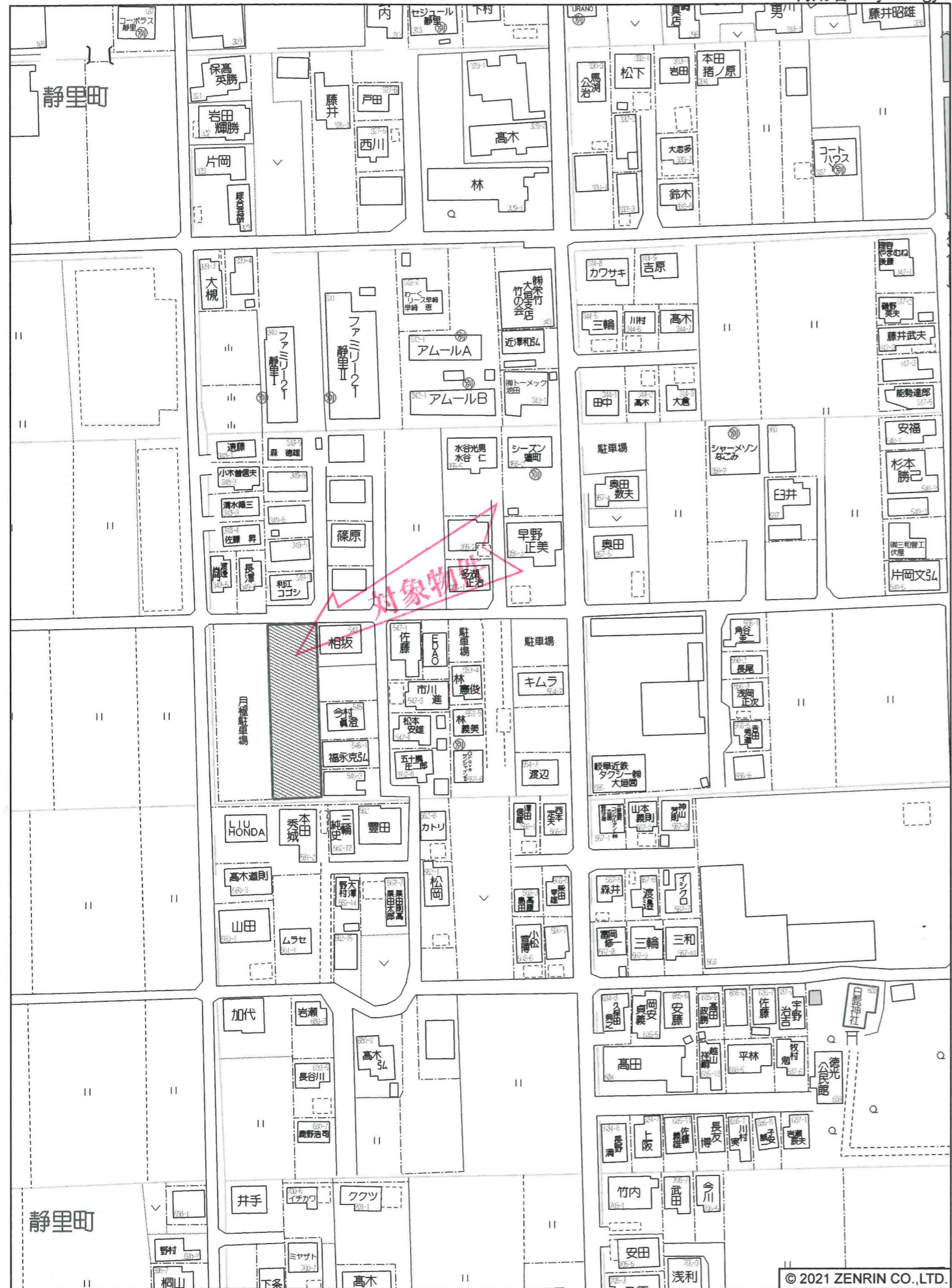
大垣市静里町付近